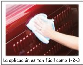
La aplicación es tan fácil como 1-2-3

la superficie y deje que se fije por 5-15 minutos. Cuando el producto se seca como una neblina - limpie con un paño limpio y suave para un brillo ¡excepcional y duradero!